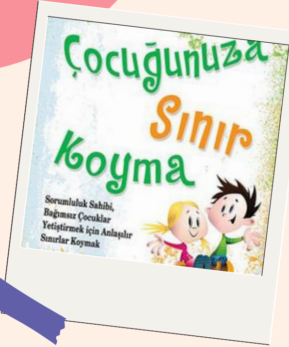
Çocuğunuza Sınır Koyma Robert J. Mackenzie

5. Kararı Uygulama : Çocuk verilen seçeneklerden sonra sınıra uymamaya devam ediyorsa hemen sonuçlarına katlanması sağlanmalıdır,